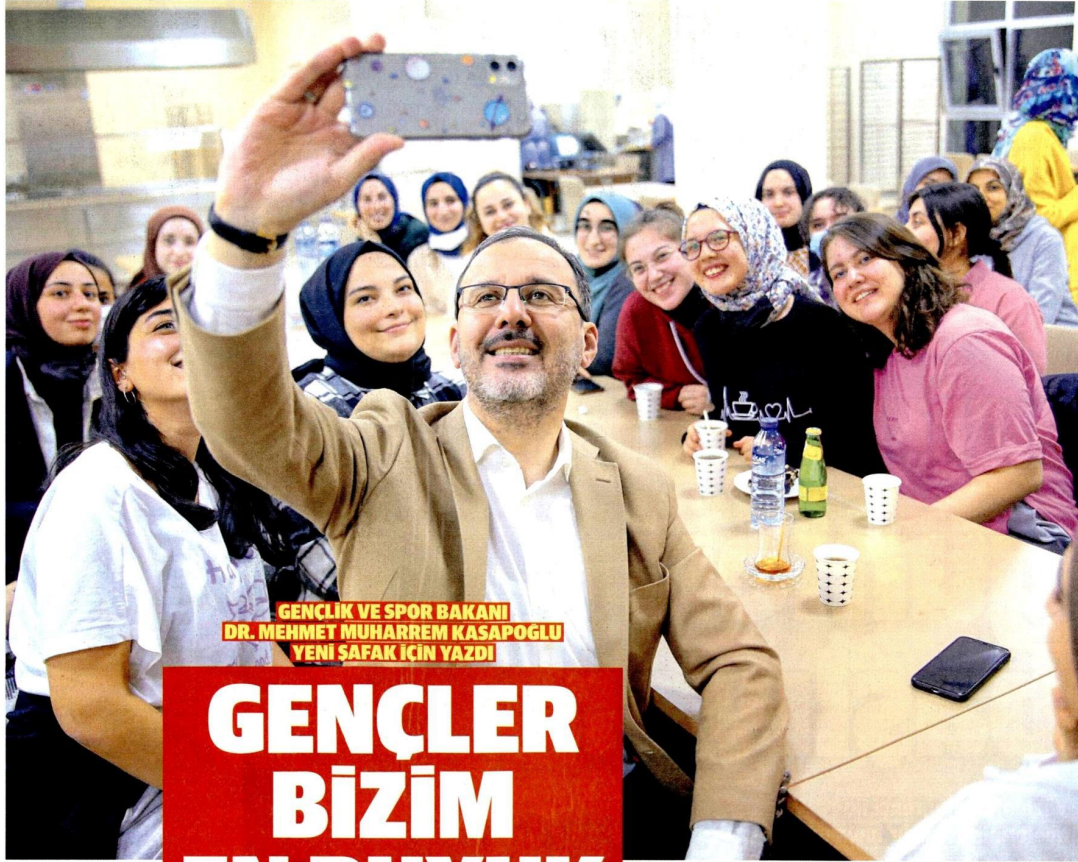
GENÇLİK VE SPOR BAKANI DR. MEHMET MUHARREM KASAPOĞLU YENİ ŞAFK İÇİN YAZDI