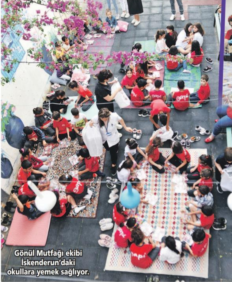
Gönül Mutfağı ekibi İskenderun'daki okullara yemek sağlıyor.