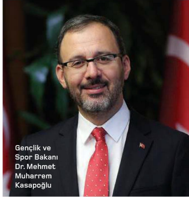
Gençlik ve Spor Bakanı Dr. Mehmet Muharrem Kasapoğlu

Vakıflar Genel Müdürlüğü (VGM), öğrencilere eğitim yardımı veren kurumlardan biri. VGM, vakfiyelerde yer alan hayır şartla-