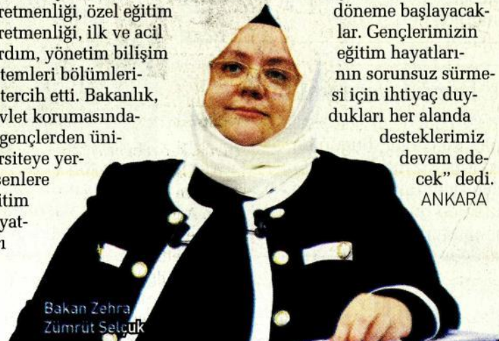
Bakan Zehra Zümrüt Selçuk

hayatlarında farklı bir döneme başlayacaklar. Gençlerimizin eğitim hayatlarının sorunsuz sürmesi için ihtiyaç duydukları her alanda desteklerimiz devam edecek" dedi. ANKARA