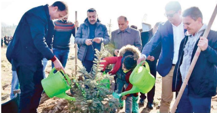
Gölbaşı Yağlıpınar Mahallesi mücavir alanda binlerce fidan toprakla buluşturuldu.

15 Temmuz'da şehit edilen Gölbaşı Özel Harekat polislerinin isimleri KYK ormanlarında yaşayacak.