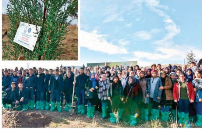
Kredi ve Yurtlar Kurumu 'nda kalan öğrenciler binlerce fidan dikti.