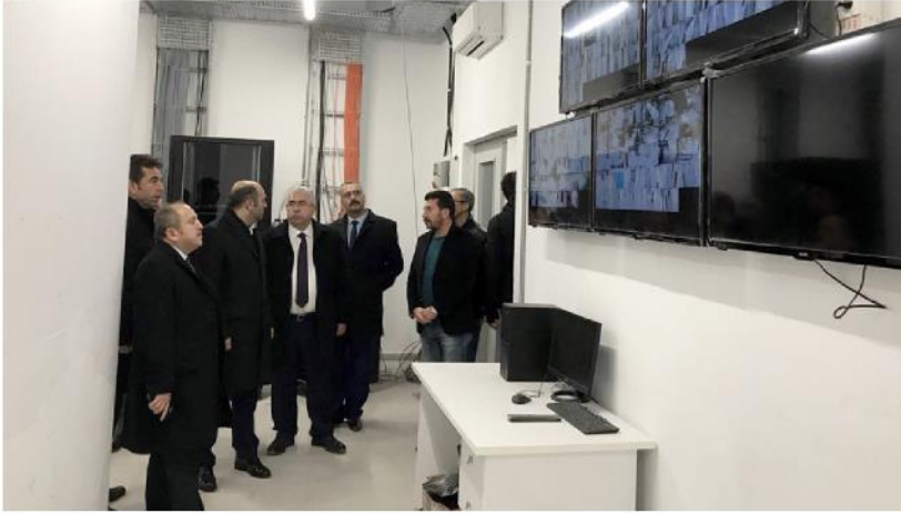
Binevler kavşağında yaptırılan 1500 kişilik öğrenci KYK'ya teslim edildi.