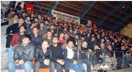
Etkinliğin yapıldığı Atatürk Spor Salonu tamamen doldu.