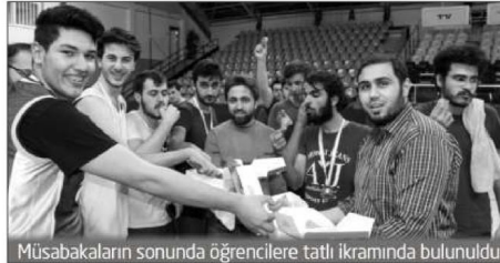
Müsabakaların sonunda öğrencilere tatlı ikramında bulunuldu