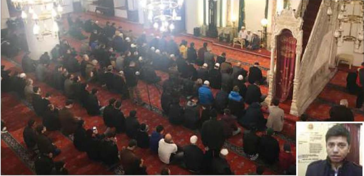
Hisar Camii'ndeki buluşmada her yaştan mümin saf tuttu.