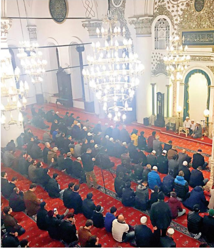
İzmir'de sabah namazında bulunan her yastan insan, sohbet edip birlik ve beraberlik vurgusu yaptı. Camiye daha çok gençlerin gelmesi, memnuniyetle karşılandı.