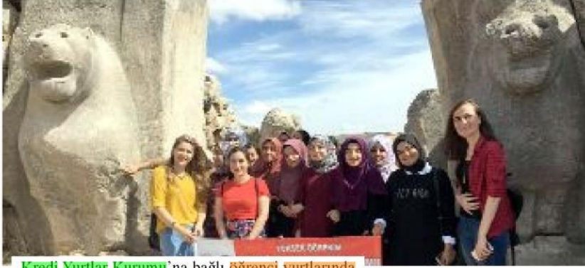
Kredi Yurtlar Kurumu'na bağlı öğrenci yurtlarında kalan gençler, Hattuşaş Aslanlıkapı'nın önündeler...