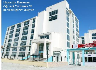
Hayrettin Karaman Öğrenci Yurdu'nda 95 personel görev yapıyor.

24 Eylül 2018 tarihinde başlayan yurt kayıtları için gelen öğrenci ve veliler misafir olarak karşılanıyor, bilgilendiriliyor ve ikramlarla ağırlanıyor. Veliler, gözlemlerini evlatlarının Devletin emin ellerinde olduğunu bilerek, hızır içinde evlerine dönüyorlar.