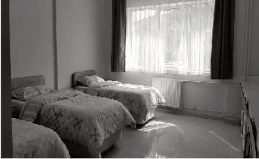
KYK Gölcük öğrenci yurdu , yeni eğitim öğretim dönemine hazır hale getirildi.