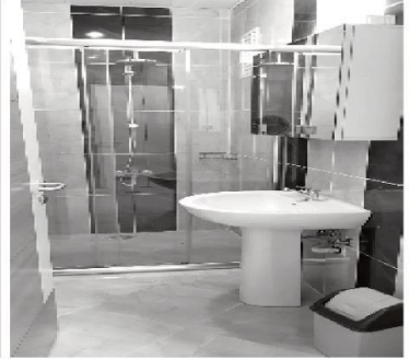
Odalarda banyo ve lavabolar da yer alıyor.