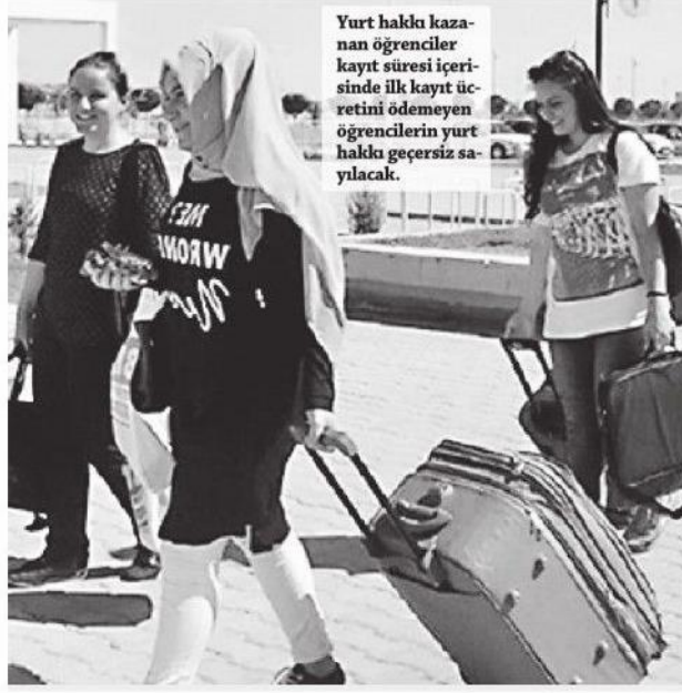
Yurt hakkı kazanan öğrenciler kayıt süresi içerisinde ilk kayıt ücretini ödemeyen öğrencilerin yurt hakkı geçersiz sayılacak.

İlk kayıt ücretini ödeyen öğrenciler, yurt kayıt işlemlerini, e-Devlet şifresi ile "turkiye.gov.tr" internet adresindeki "Yurt Kayıt İşlemleri" linkinden taahhütname onayı yaparak tamamlayacak. Öğrencilerin kayıt işlemi için yurdu bulunduğu şehre gidip başvurma zorunluluğu bulunmuyor. İlk kayıt ücretini ödeyen öğrencilerin yurt kayıt işlemlerini