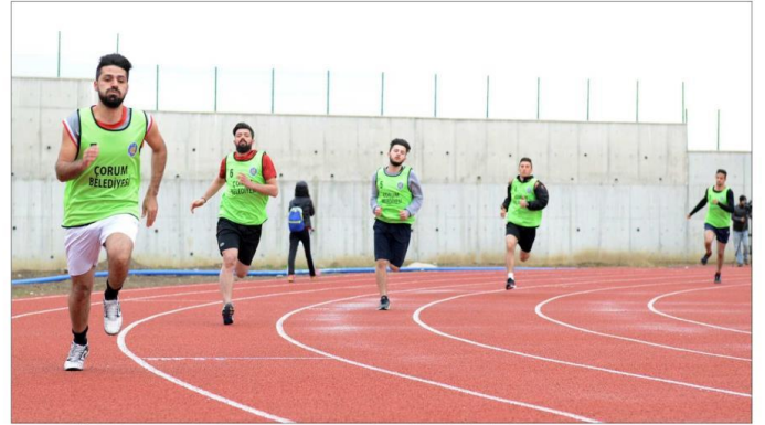
TOKİ Atletizm pistinde gerçekleşen yarışların ilk gününde 400 metre yarışları yapıldı.