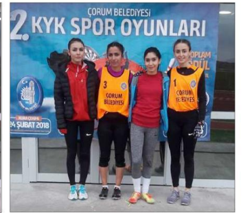
Müsabakalarda 35 sporcu birinci olabilmek için ter döktü.