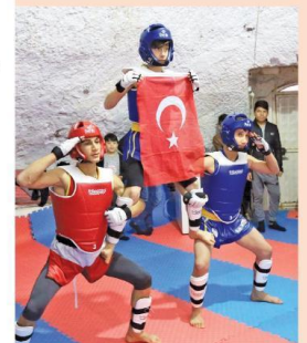
Mağaradan spor salonuna dönüştürülen mekânda çalışan öğrenciler. Türkiye şampiyonalarında dereceler elde etmeye başladılar. Uyuşturucudan kurtulan gençler spora hayata yeniden tutunmayı başardılar.

■ Evet, futbol oynadım. Basketbol oynadım ve atletizm yaptım. Küçük yasta olsaydım tek spor branşı seçmezdim. Fiziksel ve yeteneğime bağlı olurdu. Basketbol oynardım, boym uzun olsaydı. Futbol oynardım. Ama esas olarak yüzme isterdim. Yüzme herkese hitap eder. Su anda her ilde ve çoğu ilçede yüzme havuzlarımız var. Spor yapmamak için artık sebep yok. Dünyada spora en fazla yatırım yapan ülkelerin başında geliyoruz. Avrupa Şampiyonası'na da adayız.