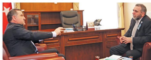
Gençlik ve Spor Bakanı Osman Aşkın Bak, Genel Yayın Koordinatörümüz Serdar Arseven'e "terörün finans kaynağı uyuşturucu ticaretiyle mücadelede dair" önemli açıklamalarda bulundu.

O yüzden ne yapmalıyız; sokaklarda biz olmalıyız. Amatör spor kulüplerine destek veriyoruz, mahallelere tesisler yapıyoruz, amatör spor kulüplerine destek oluyoruz. Örneğin bir amatör kulübü yönetiyoruz. Mahallemdeki 40 çocuk ile antrenmana çıkarttım. O sokakta siz varsınız, o çocuklara spor yaptırıyoruz, çocuk sporun keyfini aldı evine gitti. Bu olmuyunca... Sokakta yalnız kalan çocuk, kontrolsüz alanlara girmeyle hazır durumdadır ve ölüm tacerlerinin hedefindedir. Sporun olumlu etkide bulunma gücünden faydalanmak için daha fazla çaba harcamalıyız.