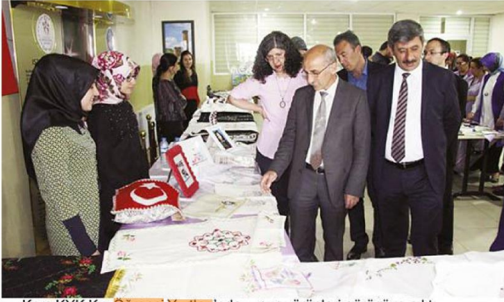
Kars KYK Kız Öğrenci Yurtları'nda kalan kız öğrencilerin el emeği göz nuru ürünleri görücüye çıktı. Kars'ta Kredi Yurtlar Kurumu

(KYK) Kız Öğrenci Yurtları'nda barınan öğrencilerin boş zamanlarını değerlendirmek için yaptığı el emeği ürünler sergide görücüye çıktı.