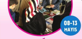
08-13 MAYIS Osmanlıca Eğitim ve Kültür Dergisi Dergi Fuarında