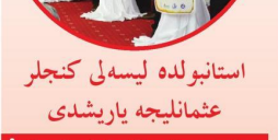
08 MAYIS İstanbul'da Liseli gençler "Osmanlıca" yarışması