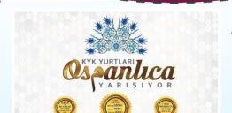
28 NISAN Merkezi Osmanlıca İmtihanı Yapıldı

İyü Evasmık Nsli İmam Hatip Orta Okulunda sene boyunca devam eden çalışmaların Osmanlıca kısmı yapılan final yarışmasında başarıyla sonuçlandı. Yarışmada öğrencilerin katıldığı programda beş masa kıyasıya yarıştı. Asna olimpiyanlara zor gelecek ya da bunu ya çocuklar yapamaz denilecek sorulara kolayca cevaplar vermeleri izleyenleri hayran bıraktı. Yarışmaları izleyenler hayran bıraktı. Yarışmaları izleyenler hayran bıraktı.