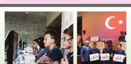
02 MAYIS Evasmık Nsli İmam Hatip Ortaokulu Osmanlıca İşini Çözdü