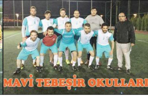
MAVİ TEBEŞİR OKULLARI