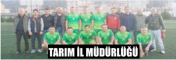
TARIM İL MÜDÜRLÜĞÜ