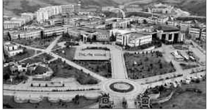
Kocaeli Üniversitesi yaklaşık 76 bin 550 öğrenci kapasitesiyle, Türkiye'nin de en kalabalık üniversiteleri arasında yer alıyor.

Y KS yerleştirme sonuçlarının açıklanmasının ardından bir üniversiteye gitmeye hak kazanan öğrenciler barınma ihtiyaçlarını karşılamak için araya geçti. 19-26 Ağustos 2019 tarihleri arasında e-Devlet üzerinden yurt başvuruları alınırken, özel yurtlar da başvuru kabulünü sürdürüyor. Kocaeli Üniversitesi'nde (KOÜ) 76 bin 550, Gebze Teknik Üniversitesi'nde (GTÜ) ise 8 bin 312 kayıtlı öğrenci bulunuyor. Kredi Yurtlar Kurumuna bağlı 15 yurdun yatak kapasitesi 14 bin 809 olurken, özel yurtların toplam kapasitesi 6 bin 502 oldu. Kocaeli'deki 84 bin 862 üniversite öğrencisi için, yurtlarda 21 bin 311 kontenjan bulunuyor.