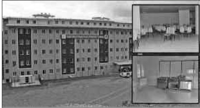
Gazi Süleyman Paşa Erkek Öğrenci Yurdu , 2 bin 75 yatak kapasitesiyle Kocaeli'nin en büyük yurdu olarak biliniyor.

Yüksek öğrenimde 2019-2020 eğitim ve öğretim yılı öğrenci kayıtları sürerken, Gençlik ve Spor Bakanlığı Kredi ve Yurtlar Genel Müdürlüğü , yeni dönem yurt başvuruları da başladı. Son verilere göre ilimizdeki iki üniversitede 84 bin 862 öğrenci kayıt yaptırırken, 15 devlet yurdu ve 49 özel yurtta toplam 21 bin 311 kişilik kontenjan bulunuyor