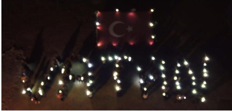
Şuhut ilçesinde bulunan KYK yurdunda kalan öğrenciler telefonlarının ışığıyla 'VATAN' yazısını oluşturarak, Barış Pınarı Harekâtı'na destek verdi

Şuhut ilçesindeki Kredi Yurtlar Kurumu (KYK) yurdunda kalan öğrenciler, Türkiye'nin güney sınırında oluşturulmaya çalışılan terör koridorunu yok etmek, bölgeye barış ve huzuru getirmek amacıyla başlatılan Barış Pınarı Harekâtı'na destek amacıyla yurt bahçesinde telefon ışıklarıyla 'vatan' yazısı oluşturdu.