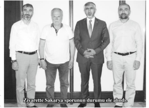
Ziyarette Sakarya sporunun durumu ele alındı.

larına da spora göstermiş olduğunuz yakın ilgi ve alakadan dolayı teşekkür ediyorum, çalışmalarınızda da başarılar diliyorum” şeklinde konuştu.