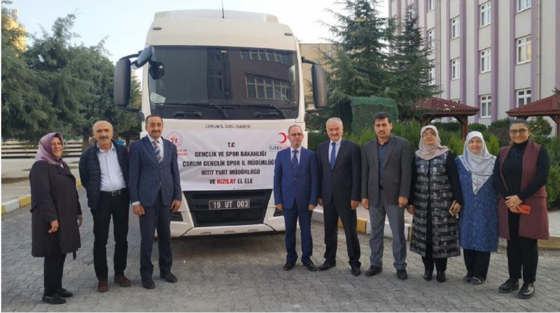
Karyolar düzenlenen programla Kızılay'a teslim edildi.

Kılıç, gazetecilere yaptığı açıklamada karyoların İl Özel İdaresince tahsis edilen turla Türk Kızılayı'nın kamp ve yetimhanelerine taşınacağını söyledi. Kılıç, katkılarından dolayı yurt yöneticilerine teşekkür etti. (A.A)