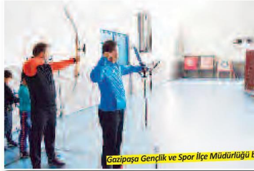
Gazipaşa Gençlik ve Spor İlçe Müdürlüğü bünyesinde açılan sportif kurslar devam ediyor.