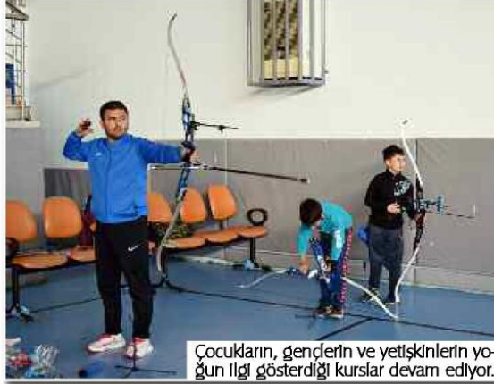
Cocukların, gençlerin ve yetişkinlerin yoğun ilgi gösterdiği kurslar devam ediyor.