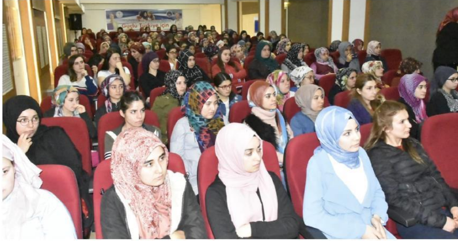
Öğrenciler konferansı ilgiyle dinlediler.