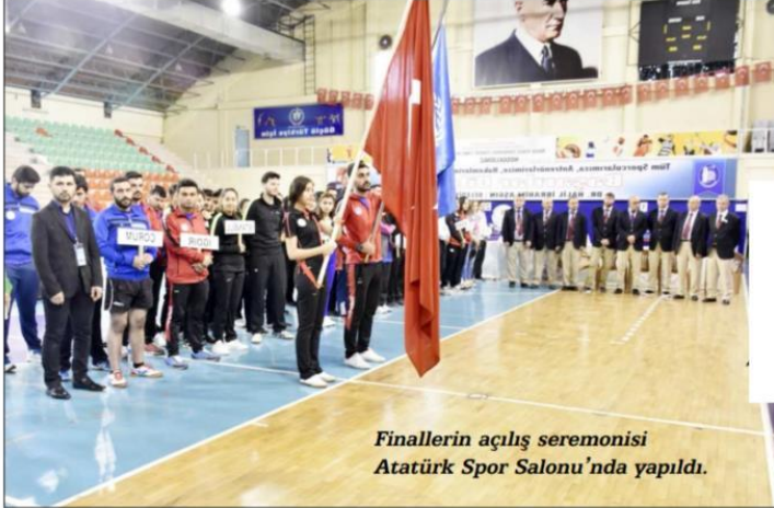
Finallerin açılış seremonisi Atatürk Spor Salonu'nda yapıldı.

Kredi Yurtlar Kurumu (KYK) Masa Tenisi Türkiye Finalleri Çorum'da başladı.