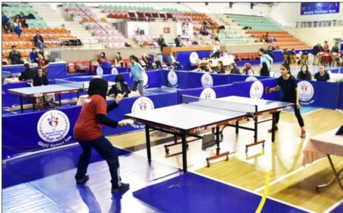
Finallerde 8 kız, 8 erkek olmak üzere 16 takım mücadele edecek.

ye çapında 8 ayrı grupta birinci olarak final oynamaya hak kazanan 8 kız 8 erkek takımı Çorum'da Türkiye Şampiyonu olmak için mücadele edecek. Kızlarda İstanbul, Batman, Uşak, Malatya, Van, Kastamonu, Trabzon, Isparta, erkeklerde ise Çorum, İstanbul, Malatya, Batman, Samsun, Iğdır, Nevşehir ve Aydın takımları ter dökcek. Dün saat 09.30'da Atatürk Spor Salonu'nda gerçekleşen açılış töreninin ardından 2 gün sürecek olan finallerin ilk maçları oynanırken, bugün yapılacak final maçlarının ardından Türkiye şampiyonu belli olacak.