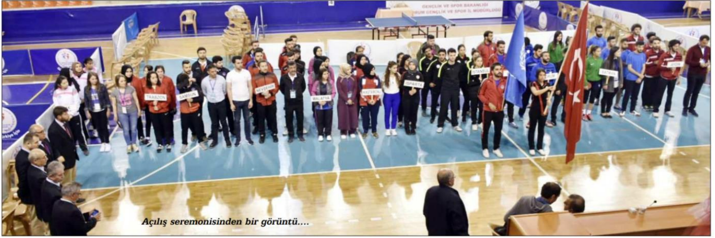
Açılış seremonisinden bir görüntü....