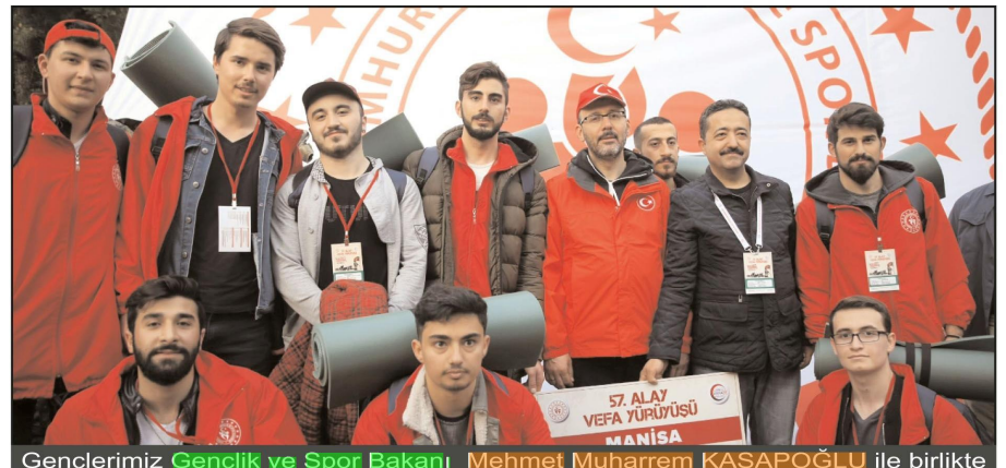
Gençlerimiz Gençlik ve Spor Bakanı Mehmet Muharrem KASAPOĞLU ile birlikte