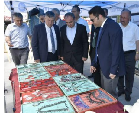
Düzenlenen sergi büyük beğeni topladı.