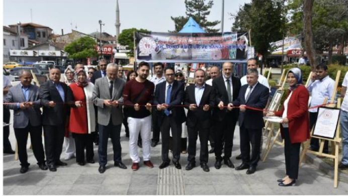
Gençlik ve Spor Müdürlüğü tarafından düzenlenen 'Yıl Sonu Kültür ve Sanat Sergisi' dün açıldı.