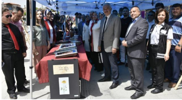
Hürriyet Parkı önünde gerçekleşen açılışa çok sayıda davetli de katıldı.