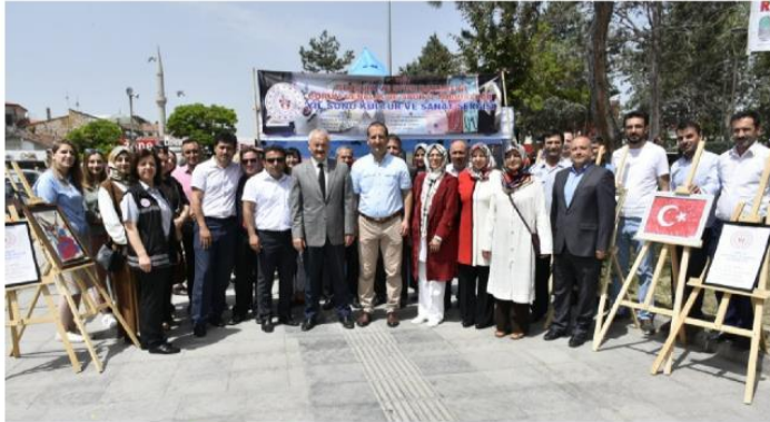
KYK'nın Çorum yurtlarında kalan öğrencilerin eserleri, sergide görücüye çıktı.