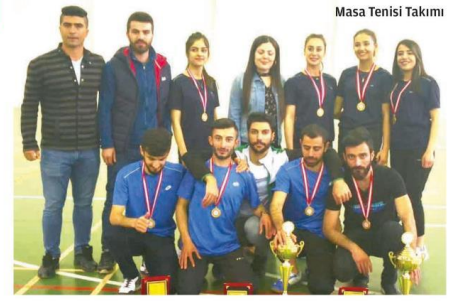
Masa Tenisi Takımı