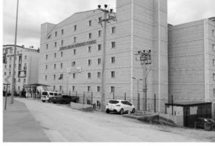
Dezenfekte alıřmaları yapılan yurtlar, yurt dıřından gelecekler iin hazırlandı.