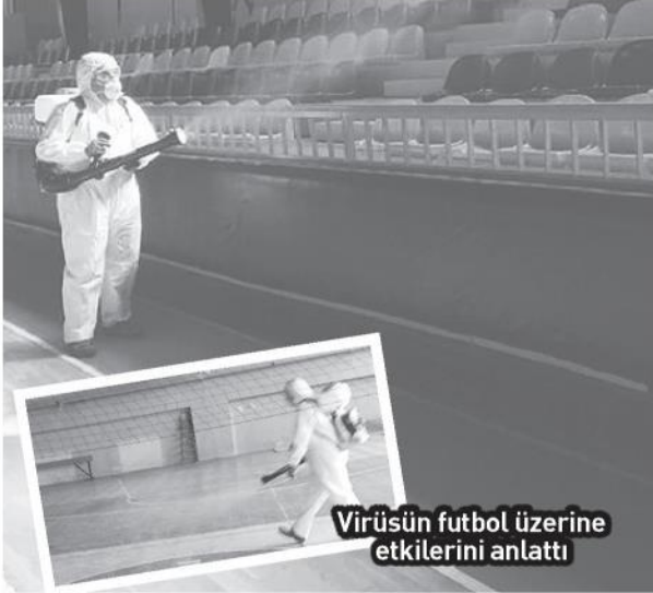
Virüsün futbol üzerine etkilerini anlattı