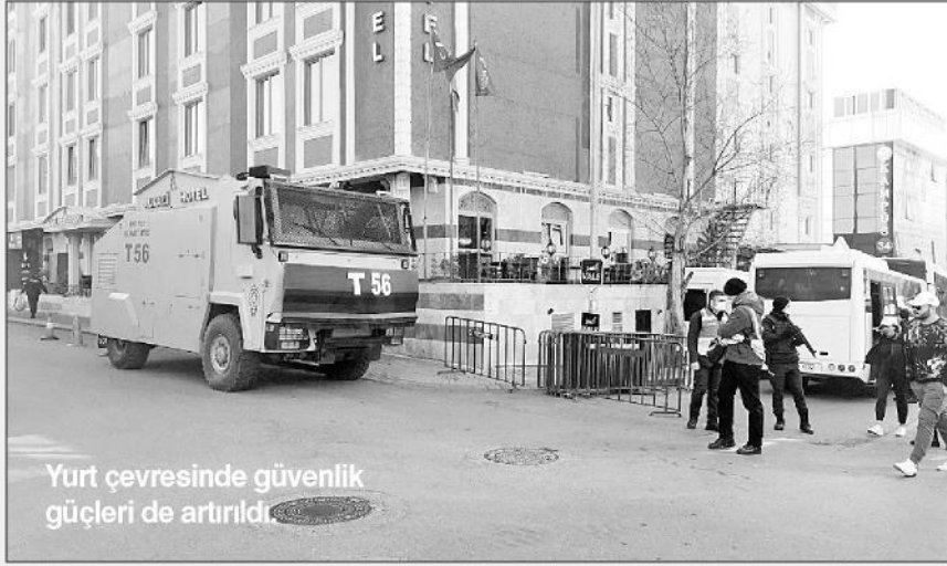
Yurt çevresinde güvenlik güçleri de arttırdı